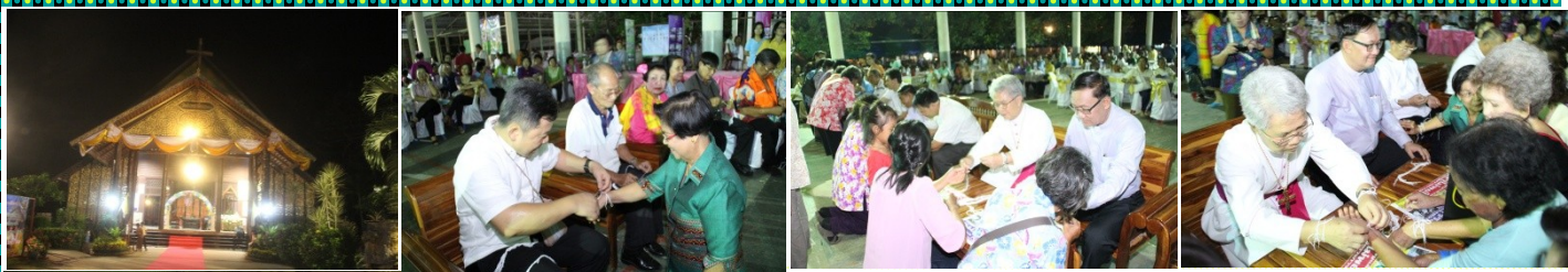
ភាពកិច្ចការងារបុណ្យមជ្ឈមណ្ឌលស្នាក់នៅ ថ្ងៃទី ២៥ ខែ មេសា ២៥៥៧