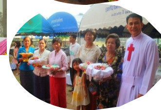
ភាពកិច្ចការងារបុណ្យមជ្ឈមណ្ឌលស្នាក់នៅ ថ្ងៃទី ២៦ ខែ មេសា ២៥៥៧