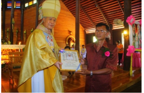
สังฆมณฑลอุบลราชธานี