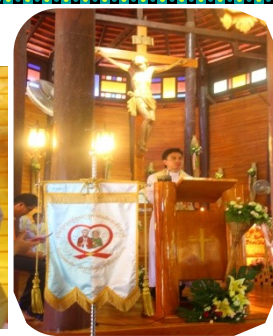
ต่อจากหน้า ๒ .....

นอกจาก ๒ โครงการดังกล่าว ทางคณะกรรมการฯ ยังได้มีการประกาศผลรางวัล “ชมรมผู้สูงอายุคาทอลิกตัวอย่าง” และ “ชมรมเครือข่ายผู้สูงอายุคาทอลิก