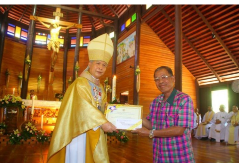
ชมรมเครือข่ายผู้สูงอายุคาทอลิกประกาศข่าวดี ปี ค.ศ. ๒๐๑๓ - ๒๐๑๔ ชมรมเครือข่ายผู้สูงอายุฯสังฆมณฑลราชบุรี