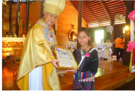
สังฆมณฑลเชียงใหม่