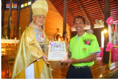
สังฆมณฑลจันทบุรี