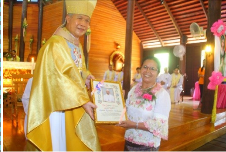
สังฆมณฑลอุดรธานี