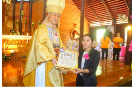
สังฆมณฑลนครราชสีมา