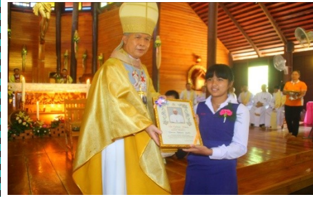
สังฆมณฑลอุบลราชธานี