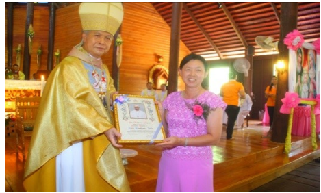
สังฆมณฑลสุราษฎร์ธานี