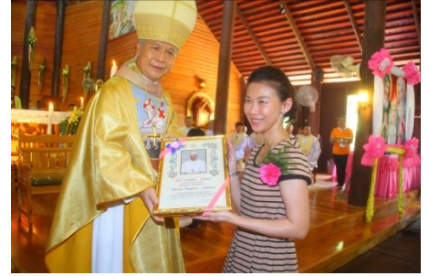
สังฆมณฑลนครสวรรค์