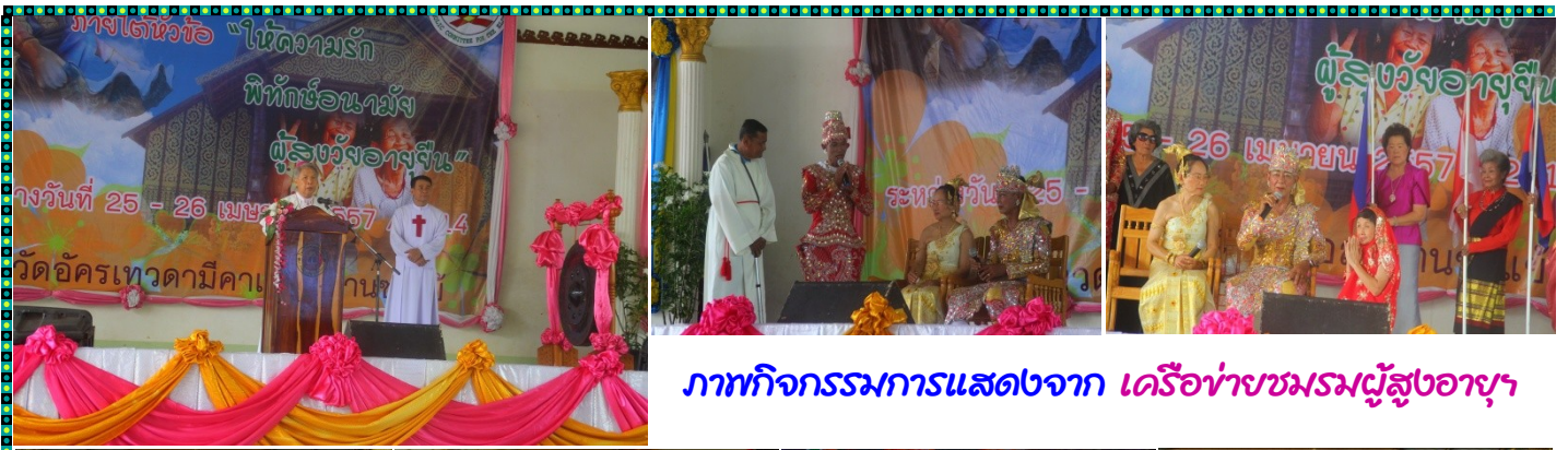
ภาพกิจกรรมการแสดงจาก เครื่อง่ายชมรมผู้สูงอายุ